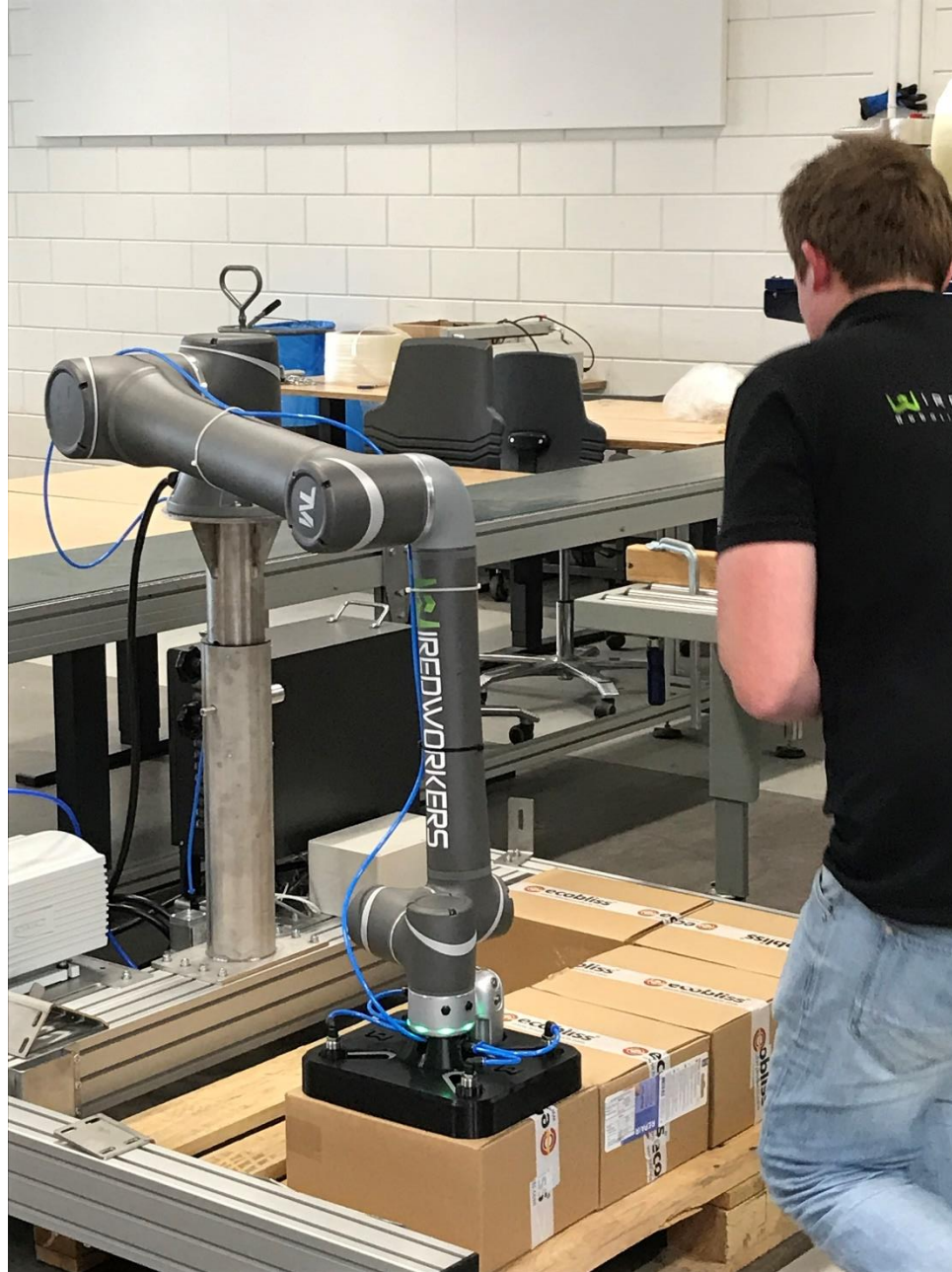
Technologie & Inclusie: Verbinden van twee werelden